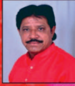
Ghanshyam Gadhvi (Lok Sahityakar)