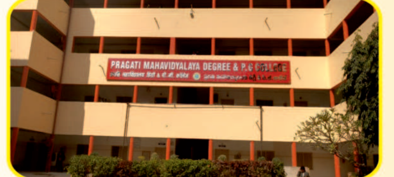
PRAGATI MAHAVIDYALAYA DEGREE & PG COLLEGE