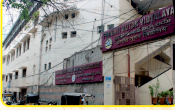
SRI GUJARATI VIDYA MANDIR JUNIOR, DEGREE COLLEGE FOR GIRLS