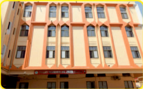
PRAGATI MAHAVIDYALAYA JUNIOR COLLEGE