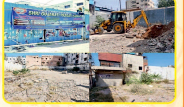
Musheerabad Property Land

Education institute for KG to PG, Guest House, Girls Hostel & BHAGINI Mahila Mandal etc.,