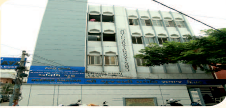
Atithi Gruh "Deepak Bhavan" ☎: 040-24753716