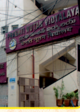
PRAGATI NUTAN VIDYALAY LKG to Vth Class