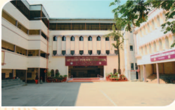
Sri Gujarati Vidya Mandir High School