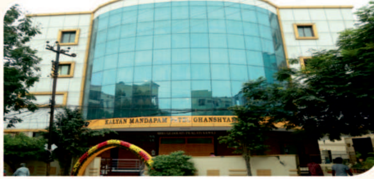
Kalyan Mandapam ☎: 040-24754657